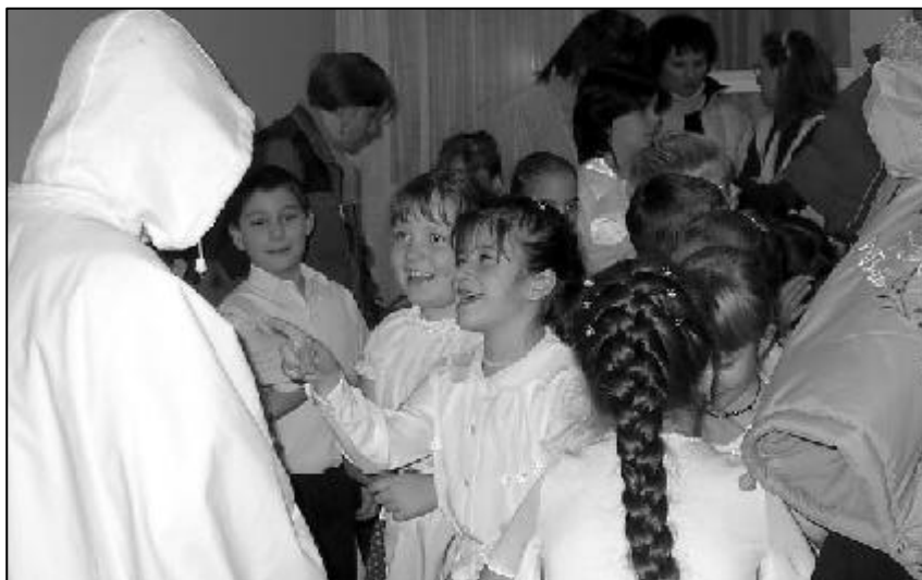
Luca-napi kavalkád. További képek és olvasnivaló a 4. oldalon.