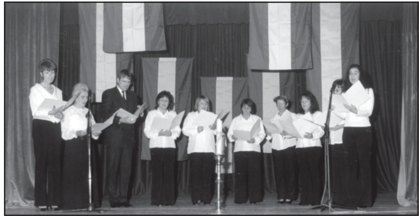
A Pedagógus Énekkar a Kormorán Együttes dalait adta elő.

ménye. Majd együtt megkoszorúzzák az iskola falán elhelyezett emléktáblát, amelyet a gimnázium állítottat a forradalom Leheles diákjai és tanár résztvevői tiszteletére.