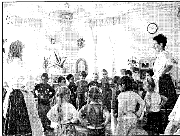
„Így kell járni...” Beszámoló a Napsugár Óvoda projektjéről (4. oldal)